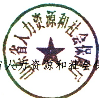
山东省人力资源和社会保障厅