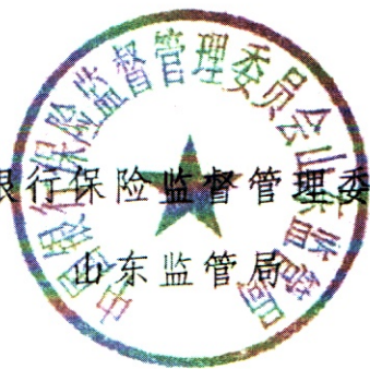
中国银行保险监督管理委员会