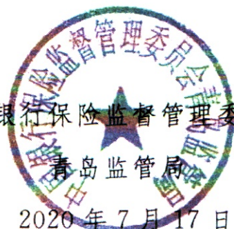
中国银行保险监督管理委员会